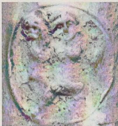
Afbeelding 2: Detail medaillon met doodshoofd

Het is een bijna ovoïde model waar als versiering op de voorzijde het generaliteitswapen met de zeven provinciën staat die vastgehouden wordt door twee staande leeuwen met toegewend gezicht. Boven de leeuwen zien we twee medaillons met daarin naakte kinderfiguren die in symmetrie geplaatst zijn en met de buitenste hand een schedel omhoog houden. Het is niet zo goed zichtbaar wat de kinderfiguurtjes in de andere hand houden; het zou kunnen zijn dat ze daarmee op een zeis rusten of een zandloper vasthouden wat ook attributen zijn die symbolisch met de dood te maken hebben. Links en rechts van het generaliteitswapen zijn vlaggen geplaatst waarop links een zon staat en rechts een staande leeuw. Rond de vlaggenmasten zijn bladranken met oranjeappeltjes gedrapeerd. De pijpenkop draagt het hielmerk De Dortse Maagd van de Goudse pijpenmaker Maarten Verzijl. Als bijmerk is aan de linkerzijde het wapen van Gouda geplaatst.